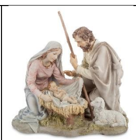
Б) Рождество Христово